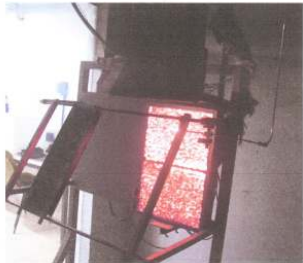
Figura 1: Equipamento de ensaio

Os corpos de prova, com dimensões de 150 \pm 5 mm de largura e 460 \pm 5 mm de comprimento, são inseridos em um suporte metálico e colocados em frente a um painel radiante poroso, com 300 mm de largura e 460 mm de comprimento, alimentado por gás propano e ar. O conjunto (suporte e corpo de prova) é posicionado em frente ao painel radiante com uma inclinação de 60^\circ , de modo a expor o corpo de prova a um fluxo radiante padronizado. Uma chama piloto é aplicada na extremidade superior do corpo de prova.