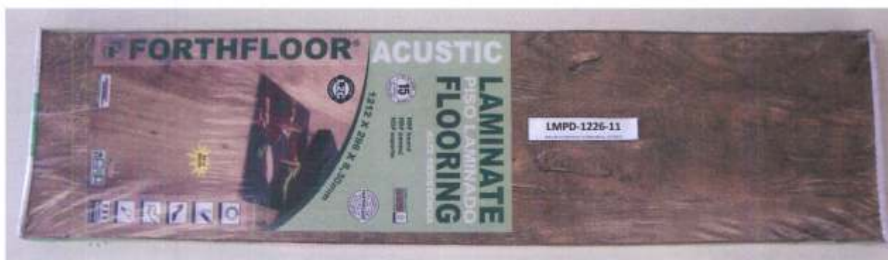
Foto 1 – Amostra de piso laminado FORTHFLOOR linha ACUSTIC recebida no laboratório.

A foto 1 ilustra a impressão da marca na amostra recebida, evidenciando que trata-se de piso laminado FORTHFLOOR, linha ACUSTIC.