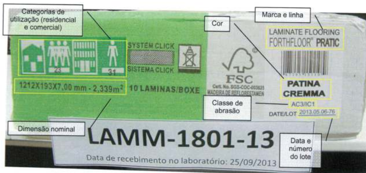
Foto 2 – Informações impressas na embalagem da amostra recebida: códigos do sistema de classificação para categorias de utilização, dimensão nominal, marca, linha, cor ou padrão, classe de abrasão, data e número do lote.