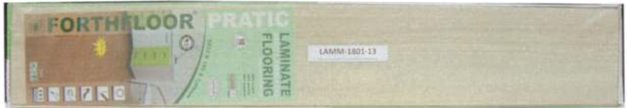
Foto 1 – Amostra de piso laminado FORTHFLOOR linha PRATIC recebida no laboratório.

A Foto 1 ilustra a impressão da marca na amostra recebida, evidenciando que trata-se de piso laminado FORTHFLOOR, linha PRATIC.